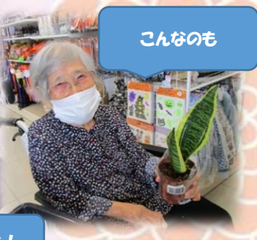
セルフレジ 初めて!